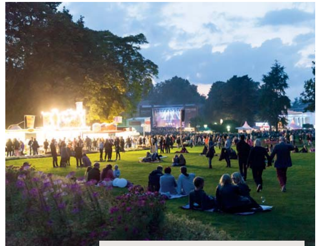
Parklichter Samstag 2016.

Am Parklichter-Samstag - präsentiert von E.ON Westfalen Weser AG - steht der wunderschöne Kurpark im Mittelpunkt. Live-Musik, Tanz und Walking-Acts verzaubern die Besucher in traumhafter Kulisse. Überall trifft man auf verkleidete Kleinkünstler und Lustwandler oder lässt sich von den Auftritten der einzelnen Bands fesseln. Auf dem nostalgischen Markt werden die Besucher in die Welt um 1900 entführt. Historische Fahrgeschäfte, eine kulinarische Zeitreise und ein faszinierendes Rahmenprogramm schaffen ein einzigartiges Ambiente. Den dramaturgischen Höhepunkt des Abends stellt das bei allen beliebte musiksynchrone Höhenfeuerwerk der Firma Flash Art dar. Doch danach geht die Party weiter. Vor der Hauptbühne und der Wandelhalle kann bis 1.00 Uhr gefeiert werden.