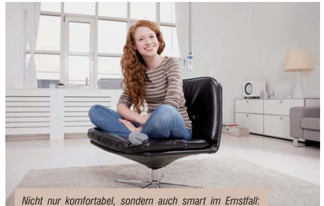
Nicht nur komfortabel, sondern auch smart im Ernstfall: Elektronische Gurtwickler für Rollläden können an Fenstern einfach nachgerüstet werden.

Wichtig ist es, Fluchtwege gedanklich bereits vor Eintritt eines möglichen Brandfalls durchzuspielen. Gerade der Fensterbereich sollte in diese Überle-