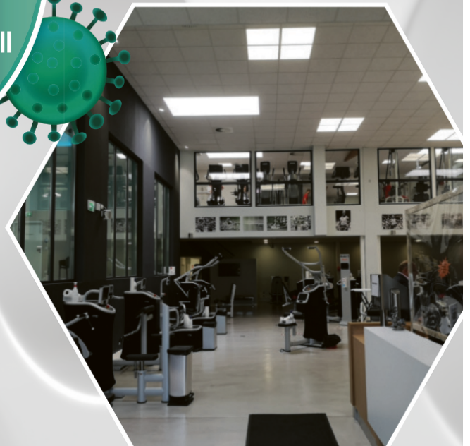
Fitness Studio Lange Fit in Höxter mit antibakterieller Wandbeschichtung