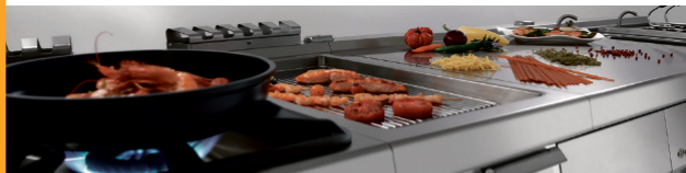
Großküchen-Geräte aus Salzkotten

GARTECHNIK | KÜHLTECHNIK | SPÜLTECHNIK | KLEINGERÄTE Bartscher GmbH | www.bartscher.com | www.bartscher-warehouse.com