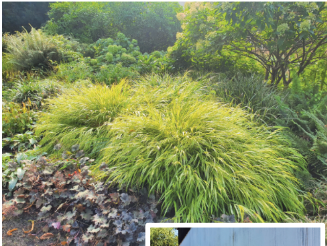
Was für eine Wucht: Japanwaldgras ( Hakonechloa macra ) umrahmt von Stauden.

Groß ist die Sehnsucht nach sommerlicher Wärme und nach viel Zeit draußen im Garten. Wenn es aber erstmal ein paar Wochen heiß und trocken war, dann blickt man möglicherweise anders auf den Rasen und auf die Blumenbeete. Wir wissen noch nicht wie dieser Sommer wird, aber wenn er sich an den Trend hält, dann dürfte auch er wieder zum Schwitzen sein und wenn wir schwitzen, dann haben viele Pflanzen im Garten Stress. Schotter und Steine ums Haus sind keine Option, denn sie heizen sich an heißen Tagen erst recht auf und geben in der Nacht, in der wir es gern zum Schlafen etwas kühler haben würden, die Hitze wieder ab. Dagegen hilft nur Schatten und eine lebendige Bepflanzung - die muss gar nicht so knallbunt sein, um zur Verdunstung beizutragen. Hobbygärtner, die sich nicht von ihrem Garten diktieren lassen wollen, wann sie zuhause bleiben müssen, um zu gießen, setzen auf robuste Pflanzen und neben schattenspendenden Gehölzen auf eine gesunde Mischung aus Gräsern und Stauden. Die Stauden sorgen für Farbe, Abwechslung und Blickfang und die Gräser sorgen mit ihren bodendeckenden Horsten dafür, dass die Erde nicht schnell austrocknet. Dazu gibt es eindrucksvolle Ähren, friedrige Büschel, zauberhafte Dolden