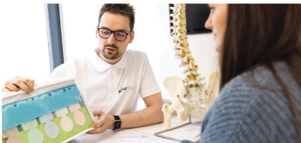
Unverbindliche Beratungstermine zu Bett, Matratze, Lattenrost und Kopfkissen inklusive kostenloser Analyse am Liege-Simulator bei schlafTEQ Paderborn