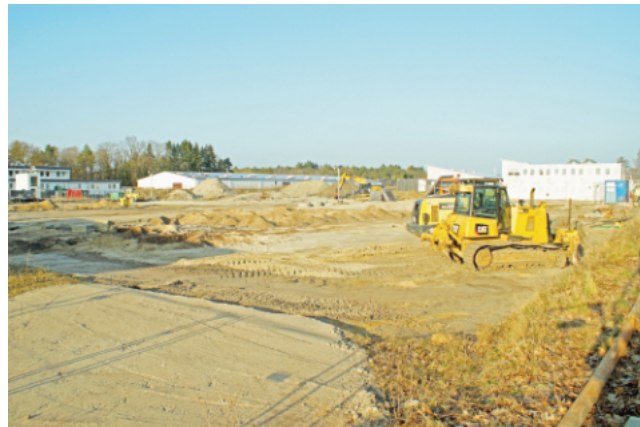
Zwischen Strothebach und Raiffeisenstraße soll die Abwärme eines neuen Großrechners genutzt werden.

reiterrolle übernehmen und durch den Bau von zwei Nahwärmekraftwerken zukunftsweisend sein. Dabei sollen Windenergie, Biomasse und Abwärme genutzt werden, um sowohl öffentliche Gebäude als auch Privathaushalte mit Wärme und Brauchwasser zu versorgen. In Zeiten guter Windausbeute muss bereits heute ein großer Teil der erzielbaren Energie an der Leipziger Strombörse zu Dumpingpreisen an-