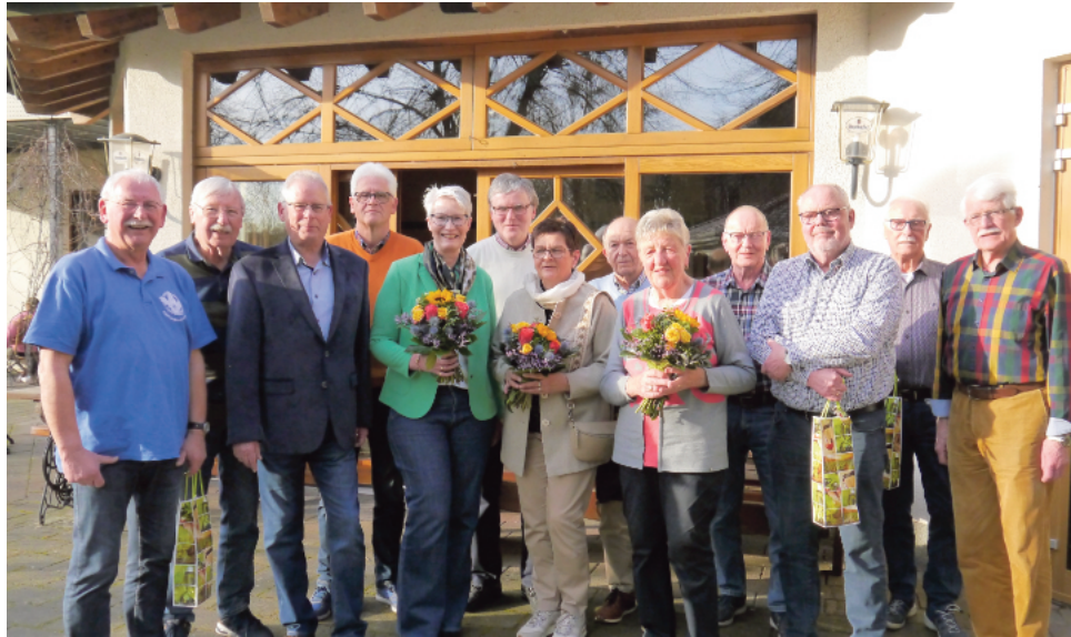
Eggegebirgsverein Vorstand und geehrte Mitglieder.