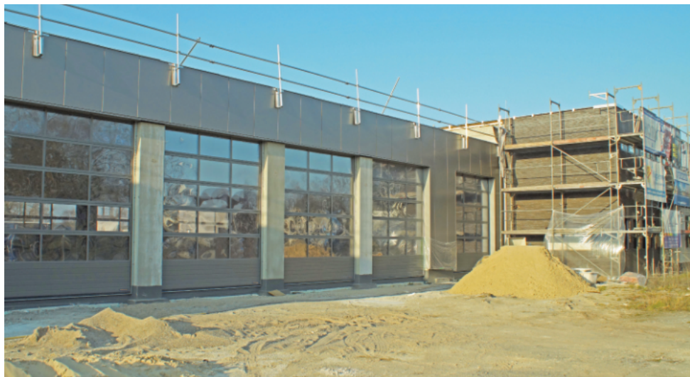
Die großen Rolltore der Fahrzeughalle sind bereits installiert.

dem Schützenfest und dem Stadtfest.“ Näher möchte sich das Stadt- oberhaupt momentan noch nicht festlegen.