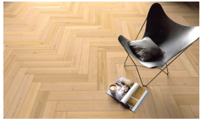
Echtes Parkett, hier im klassischen Fischgrät-Muster, steht für Natürlichkeit und Langlebigkeit.

Bad Lippspringe. Erst der passende Bodenbelag verleiht jedem Raum eine individuelle Wirkung. Neben der Optik und Haptik kommt es vielen dabei insbesondere auf Langlebigkeit und eine einfache Pflege an. Strapazierfähige Vinylböden weisen eine authentische Oberflächenstruktur auf, während klassisches Parkett für einen natürlichen Charakter steht. Das belastbare Laminat wiederum punktet mit einer täuschend echten Holzoptik. Angesichts dieser Vielzahl an Optionen fällt die Auswahl oft nicht leicht. Wichtig ist es daher, die eigenen Anforderungen und Wünsche an den persönlichen Wohnstil zu kennen. Im Folgenden gibt es einen Vergleich der beliebtesten Bodenbeläge.