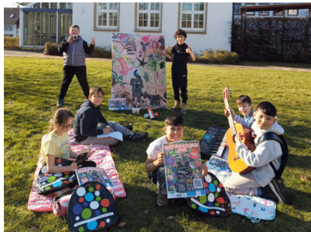
Bereit, um ihren persönlichen Kulturrucksack zu packen – Jugendliche aus Salzkotten stöbern im neuen Kulturrucksack-Programm.

„Viele Projekte finden in der Ferienzeit statt und sind heiß begehrt“, betonen die Organisatorinnen beider Kulturämter. Los geht es am ersten Ferientag der Osterferien, am Montag, 14. April.