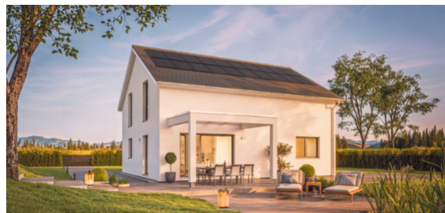
Kompakt und familienfreundlich: Dieses Eigenheim mit 165 Quadratmetern Wohnfläche und klassischem Satteldach bietet ein gutes Preis-Leistungsverhältnis.

Bad Lippspringe. Der Wunsch nach einem Eigenheim ist ungebrochen – doch um diesen Traum zu verwirklichen, sind kostensenkende Ideen gefragt. So kann ein etwas kleineres Baugrundstück dazu beitragen, mehr finanziellen Spielraum zu schaffen. Im Trend liegen zudem kompaktere Hausentwürfe, ohne dass die Bewohner auf Wohnkomfort verzichten müssten. Eine clevere Vorplanung mit bewährten Grundrissen trägt ebenso zu einem budgetoptimierten Bauen bei: Auf die Ansprüche von Familien mit einem oder zwei Kindern sind zum Beispiel die vier Jubiläumshäuser zum 65-jährigen Bestehen des Fertighausherstellers Weber-