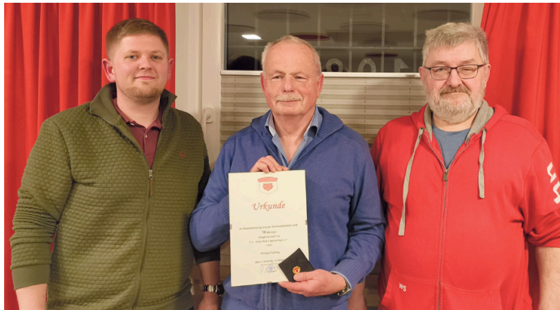
Von Erfolg gekrönt war außerdem das im vergangenen Jahr veranstaltete „Schnuppertraining“, das interessierten Kindern und Jugendlichen die Möglichkeit bot, die Sportart Badminton unverbindlich auszuprobieren und dabei gleichzeitig den Verein kennenzulernen. Die Veranstaltung eines erneuten „Schnuppertrainings“ wurde positiv aufgenommen. „Unser Ziel

gen, werden diese nun an ihre ersten Turniererfahrungen herangeführt. Ziel ist es, den aufstrebenden Nachwuchsspielern die Freude am spielerischen Wettkampf näherzubringen.