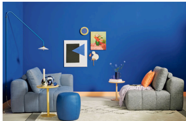
Pinselfoch. Die Trendfarben machen mehr aus dem Zuhause, hier mit der sommerblauen Wandfarbe "Cornflower".

Bad Lippspringe. Mit Farbe zieht Abwechslung ein ins Zuhause. Eine neue Gestaltung der Wände verändert die Atmosphäre im Handumdrehen und lässt sich zudem besonders unkompliziert verwirklichen. Wer Lust auf einen buchstäblichen Tapetenwechsel hat, findet mit den angesagten Trendfarben für das Jahr 2025 besonders viel Auswahl: Von einem kräftigen Blau über eine sommerliche Farbe, die an das Rot von Wassermelonen erinnert, bis zu vier angesagten sanften Pastelltönen reicht die Bandbreite für mehr Freude am individuellen Wohnen.