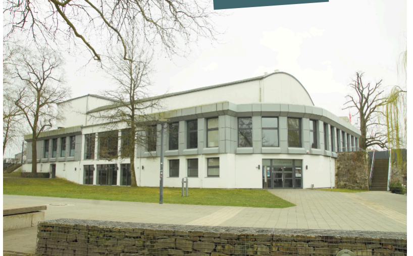
Das heutige Kongresshaus entstand in den 1950er Jahren. Es wurde nach funktionellen und praktischen Aspekten geplant und erbaut. Es entspricht dem, was man damals für „modern“ hielt. Bis heute sind in den Kellerräumen die dicken Mauern der Burg erhalten, auf deren Fundamenten auch Teile des Kongresshauses stehen.

Bad Lippspringe. In Zusammenarbeit mit dem Heimatverein bringen die Bad Lippspringer Nachrichten eine Serie von Beiträgen über ehemalige Gebäude im Kurort, die manchmal noch in der Erinnerung älterer Mitbürger existieren. Dank des Fremdenverkehrs im Kurort wurden viele dieser historischen Ansichten auf Bildern und Ansichtskarten dokumentiert. Der Heimatverein gibt einen Einblick in sein