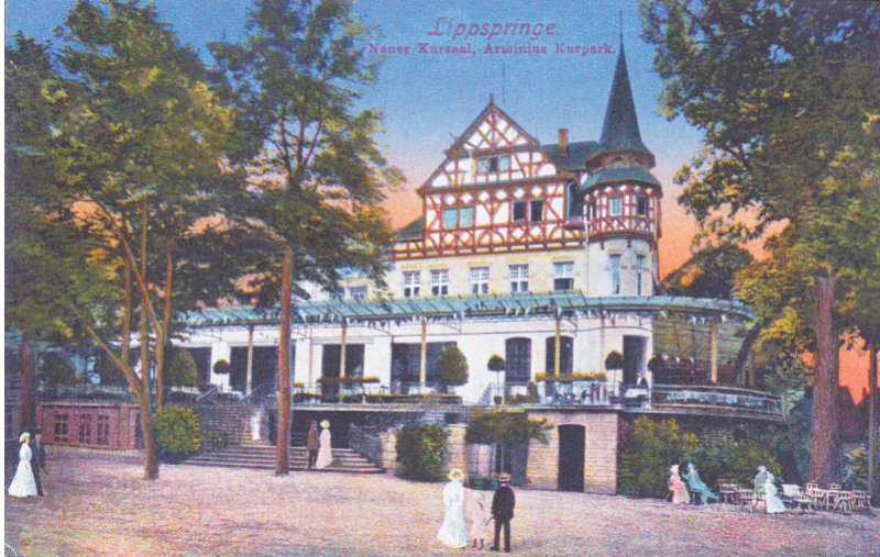
Die Ansichtskarte aus dem Jahr 1910 zeigt den ganzen Stolz der damaligen Arminiusbad-Gesellschaft. Ein breiter Treppenaufgang öffnete sich zum Arminiuspark. Das Hotel musste am 07. August 1956, nach Beschädigungen während der Besatzungszeit, dem Kongresshaus weichen.