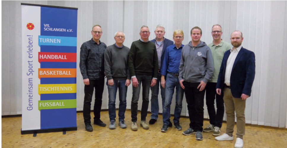
Der frisch gewählte Vorstand des VfL bei der JHV

Verein verzeichnet stärksten Mitgliederanstieg seit Jahren